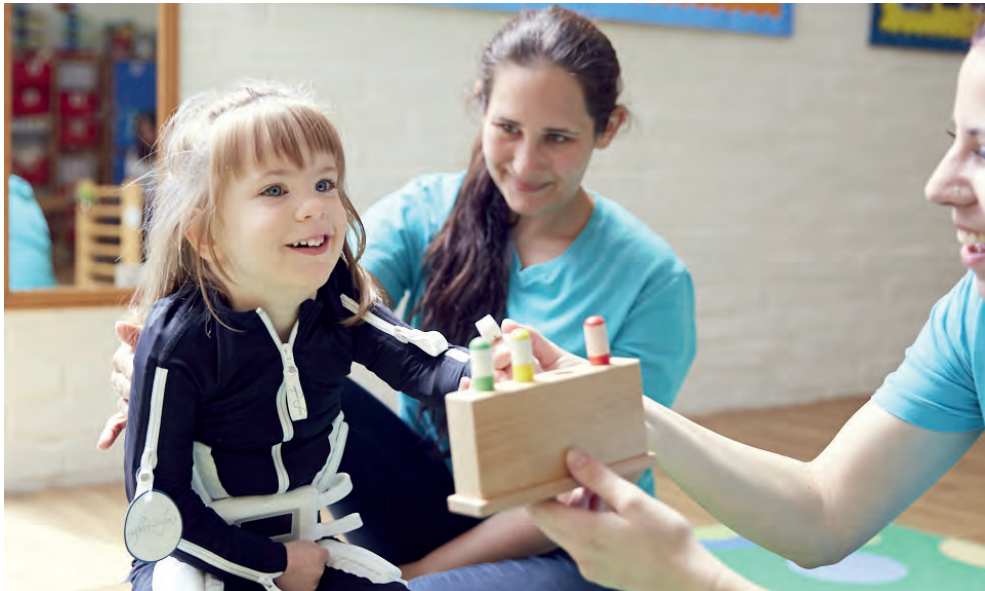
Bilde från Mollii-projektet