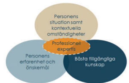
Figur 1: Socialstyrelsens visualisering av Evidensbaserad praktik (Socialstyrelsen, 2019)