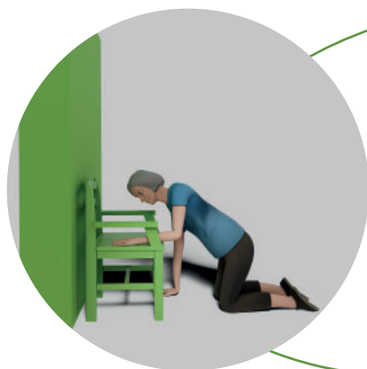
4. Ta upp en arm på stolen.