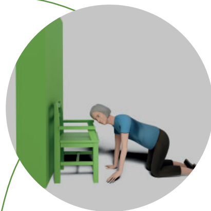
3. Vänd dig till fyrfota.