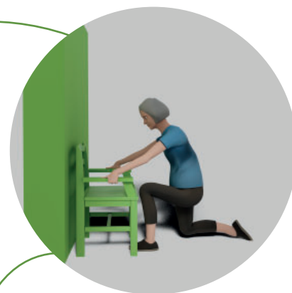
6. Flytta händerna till armstöden och lyft fram foten med ditt starkaste ben.