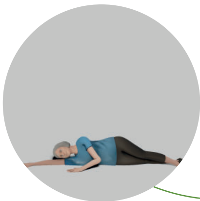
1. Ligg på golvet