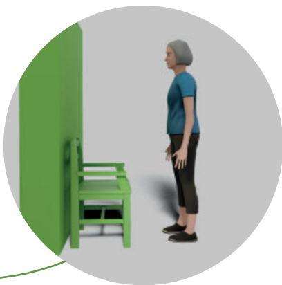
8. och sedan det andra benet tills du står upp.