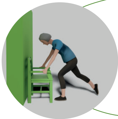
7. Med stöd av stolen sträck på det främre benet