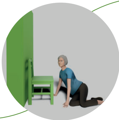
2. Böj höfterna så att du kommer upp till sittande.