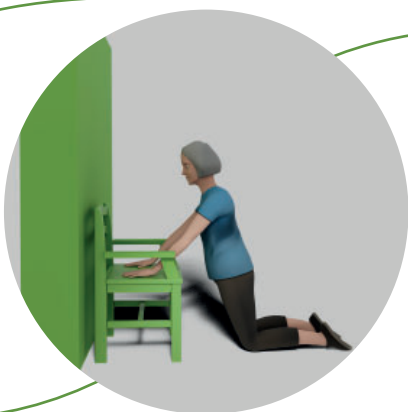
5. Ta upp den andra armen så att du står på knä.