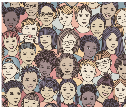
Bilder: Adobe Stock, Franzi draws

Några av projekten har haft större frihet än vad som är brukligt i utvecklingsprojekt, främst inom delprojektet. Det har inte funnits färdigformulerade delmål att verka mot, vilket har inneburit att olika idéer till bryggor mellan organisatoriska mellanrum belysts på olika platser. Denna kreativitet har varit en tillgång och en utmaning i delprojektet och piloterna.